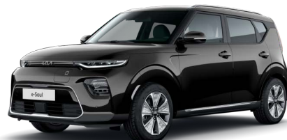
Černá Cherry (9H)