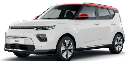
Bílá Clear + Červená Inferno (střecha) (AH1)