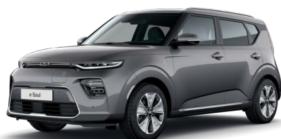
Šedá Gravity (KDG)