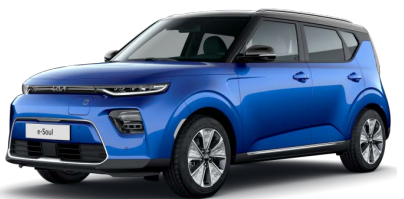
Modrá Neptune + Černá Cherry (střecha) (SE2)