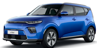
Modrá Neptune (B3A)