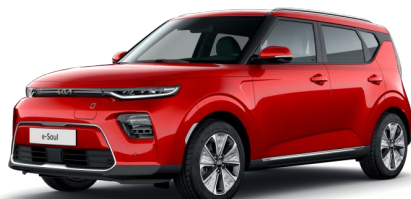
Červená Inferno (AJR)