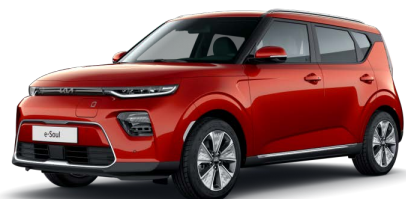
Oranžová Mars (M3R)