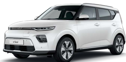
Perleťová Bílá Snow (SWP)