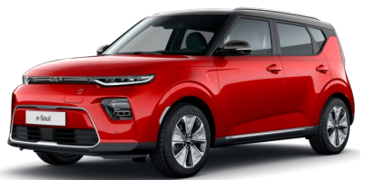
Červená Inferno + Černá Cherry (střecha) (AH4)