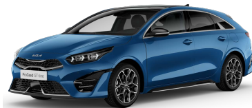
Modrá Flame (B3L)