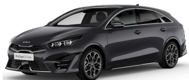
Šedá Penta Metal (H8G)