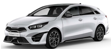
Perlet'ová Bílá Deluxe (HW2)