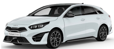
Bílá Cassa (WD) - není dostupná pro GT