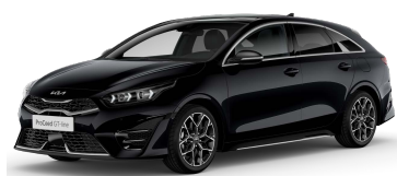
Perlet'ová Černá (1K)