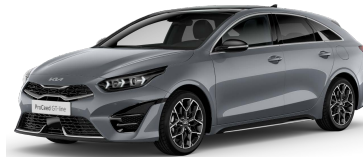
Stříbrná Lunar (CSS)