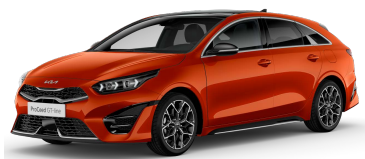
Oranžová Fusion (RNG)