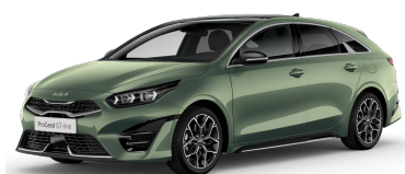
Zelená Experience (EXG)