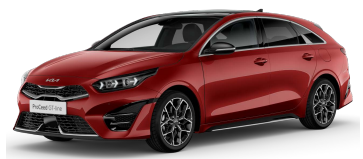
Červená Infra (AA9)